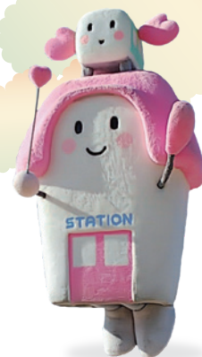
JR四国公式イメージキャラクター すまいるえきちゃん