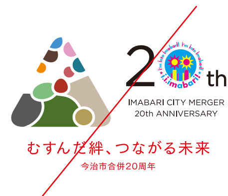
規定以外の色を使わない