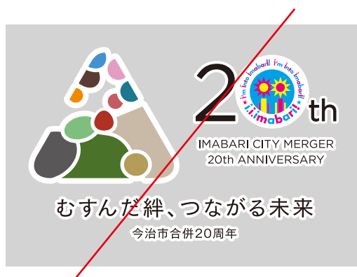
白フチを加えない