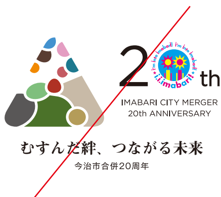
ロゴタイプのフォントを変えない