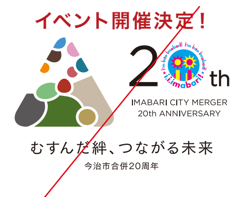
アインレイション範囲内に文字等を入れない